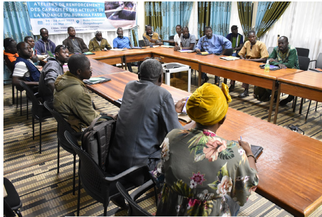
AfWASA Specialist Group

Rappelons que cet atelier de formation s'intègre dans un programme financé par la Fondation Bill and Melinda Gates via le Cabinet EDE/TA Hub dont l'Office National de l'Eau et de l'Assainissement est le principal bénéficiaire. Il a été conduit par l'AAEA en collaboration avec son Partenaire Régional de Mise en Œuvre (PREMO), le Centre des Métiers de l'Eau (CEMEAU) du Burkina Faso.