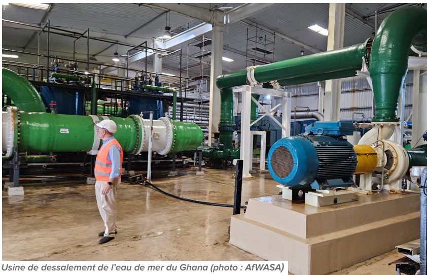
Usine de dessalement de l'eau de mer du Ghana

Le Cap-Vert est généralement reconnu comme le premier pays de l'ouest africain à avoir mis en place une usine de dessalement de l'eau de mer à grande échelle en 1959, avec l'installation de la première unité dans la station de dessalement de l'aéroport international de l'île de Sal, d'une capacité de 21,6 m 3 /j. Peu à peu, le dessalement est devenu un impératif pour répondre aux besoins en eau des populations urbaines. Dans la ville de praia, deux usines de dessalement electra sont en service, avec une capacité de production de 15 000 m 3 d'eau/j. Au moins 60 % de la population de la capitale reçoit de l'eau dessalée.