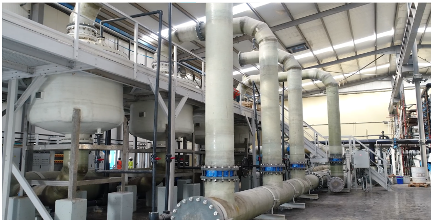
Usine de dessalement de l'eau de mer de Djibouti

Le présent article passe en revue l'état des lieux dans quelques pays Africains qui se sont lancés dans le dessalement de l'eau de mer, en examinant les opportunités, de même que les défis et les solutions.