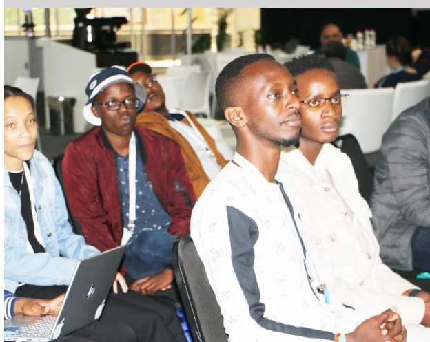
Young Innovators Forum, IFAT, Johannesburg

AfWASA's STC meeting was held in parallel with IFAT, Germany's largest water and wastewater industry trade fair. As a partner of the fair's organizer, the German Water Partnership, AfWASA was invited to present its programs and projects. The Association led a number of sessions to share its experience in implementing water and sanitation programs, linking players through peer partnerships, benchmarking visits, audits, training... Young professionals and gender development programs were also presented.