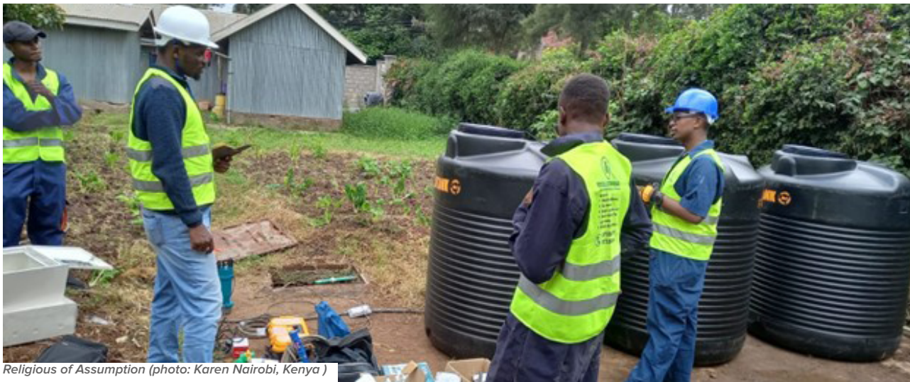
Religious of Assumption