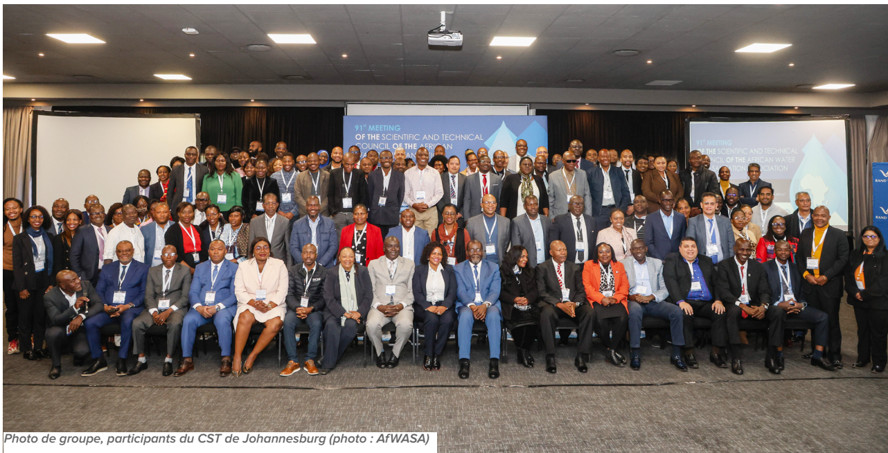
Photo de groupe, participants du CST de Johannesburg