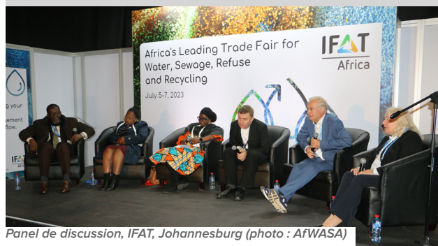
Panel de discussion, IFAT, Johannesburg

Les assises du CST de l'AAEA se tenaient en parallèle avec le salon IFAT, la plus grande foire des industriels allemands du secteur de l'eau et de l'assainissement. Partenaire avec l'organisateur de la foire à savoir le Partenariat Allemand pour l'Eau, l'AAEA a été invitée à présenter ses programmes et projets. Ainsi, l'Association a animé diverses sessions pour partager son expérience en termes de mise en œuvre de programmes basés sur l'eau et sur l'assainissement, mise en relations d'acteurs en travers de partenariats par pairs, des visites de benchmarking, des audits, des formations... Les programmes des jeunes professionnels et de développement du genre ont également été présentés.