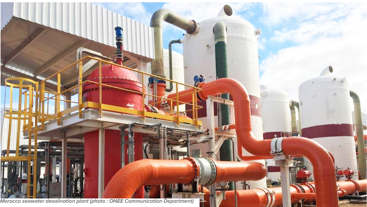
Morocco seawater desalination plant

This article reviews the state of play in a number of African countries that have embarked on seawater desalination, examining the challenges and opportunities, as well as the environmental implications.