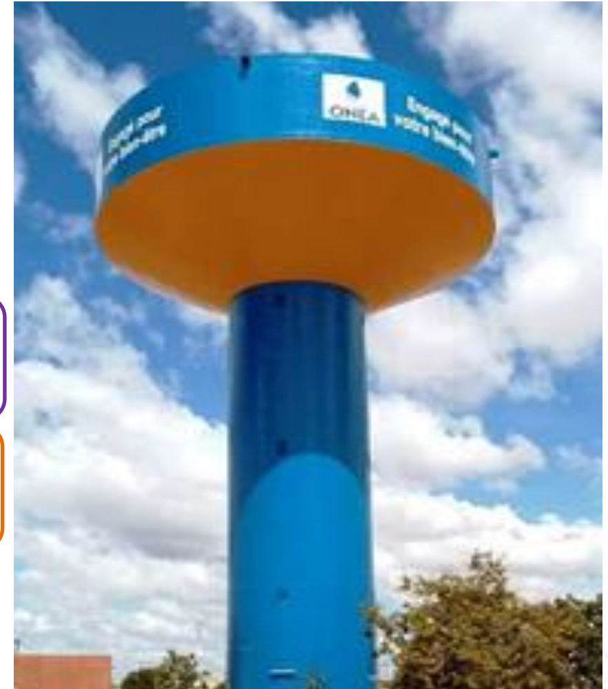
Château RE Pissy, Ouagadougou

Dégradation des indicateurs de performance